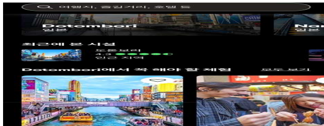
[그림 1] 트립어드바이저의 'AI 기반 맞춤형 여행지 추천 기능' 화면

특히 28개 언어를 지원하여 전 세계 다양한 국가의 이용자들이 손쉽게 접근할 수 있다는 점에서 언어적 접근성과 글로벌 활용성이 매우 높다. 실제 사용자들의 후기와 평점을 바탕으로 신뢰도 높은 정보를 제공하지만, 일부 거짓 리뷰나 광고성 후기 등으로 인해 정보의 객관성이 떨어질 위험도 존재한다. 따라서 트립어드바이저는 정보의 양과 편리함을 강점으로 가지는 반면에 리뷰 신뢰성 문제가 주요 한계로 지적된다. 반면, 아틀라스 옵스큐라는 탐험과 호기심을 자극하는 여행시스템으로, 일반적인 관광지보다 숨겨진 명소나 이색적인 장소를 발굴하는 데 초점을 둔다. 이용자는 평소 접하기 어려운 독특한 장소를 통해 색다른 여행 경험을 얻고, 색다른 여행의 깊이를 더할 수 있다. 단순한 관광 정보 제공을 넘어 세상을 새롭게 바라보는 시간을 제시한다는 점에서 의미가 있다. 그러나 외진 지역이 많고 최신 정보가 부족해 실제 여행으로 이어지기 어려운 경우가 있으며 영어로만 제공되는 언어적 제약과 정보 업데이트의 한계도 단점으로 꼽힌다. 결과적으로 트립어드바이저가 여행의 현실적 길잡이라면 아틀라스 옵스큐라는 여행의 영감과 발견의 안내자라고 할 수 있다. 두 플랫폼은 모두 여행자의 만족을 목표로 하지만 트립어드바이저는 글로벌 접근성과 실용성, 아틀라스 옵스큐라는 탐험성과 감성적 가치를 중심으로 서로 다른 여행의 방향성을 제시한다는 점에서 뚜렷한 차이를 보인다.